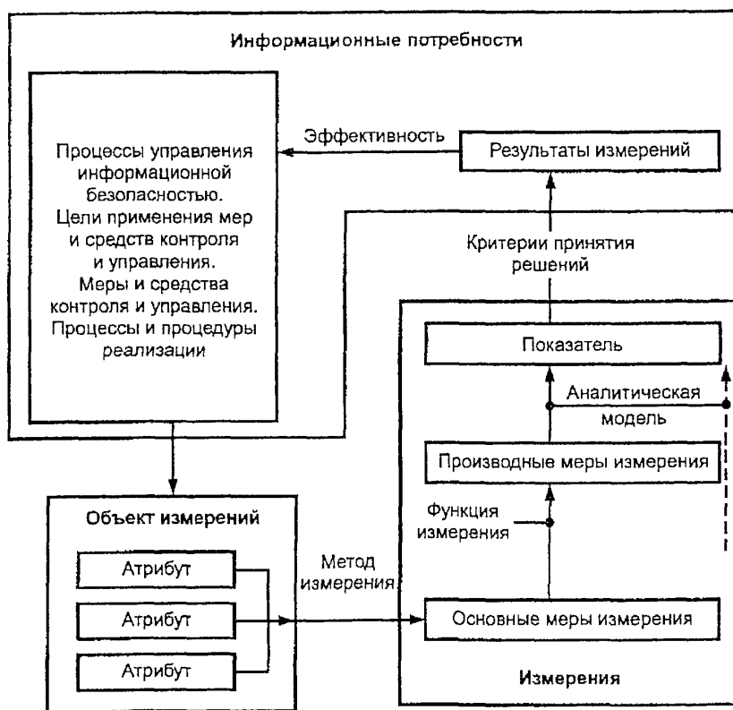
Рисунок 2. Модель измерений

Примечание. Подробная информация об отдельных элементах модели измерений приведена в разделе 7.