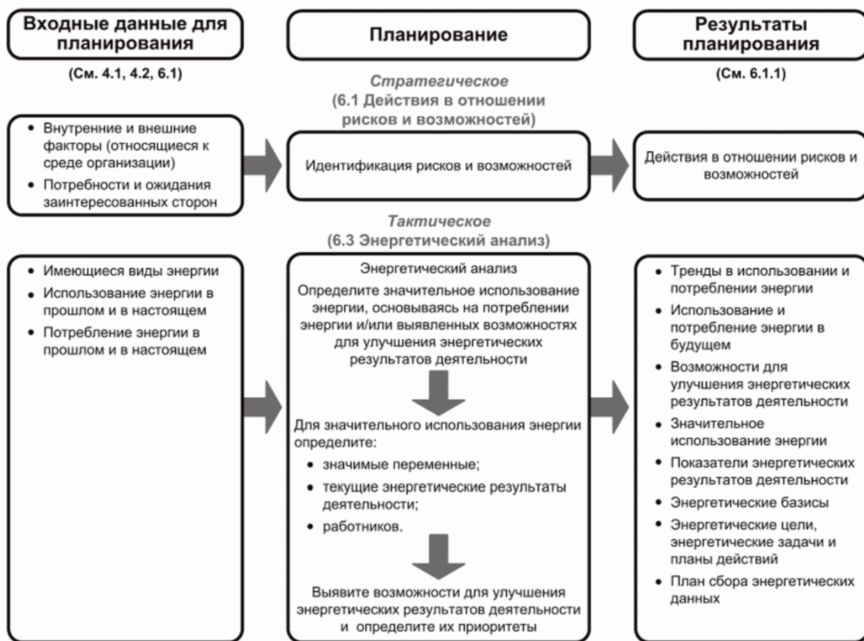
Рисунок А.2 - Процесс энергетического планирования