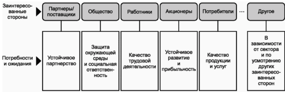
Рисунок 2 - Примеры заинтересованных сторон и их потребностей и ожиданий

Перечень заинтересованных сторон может значительно меняться с течением времени и отличаться в зависимости от организации, отрасли, культуры и страны. На рисунке 2 приведены примеры заинтересованных сторон и их потребностей и ожиданий.