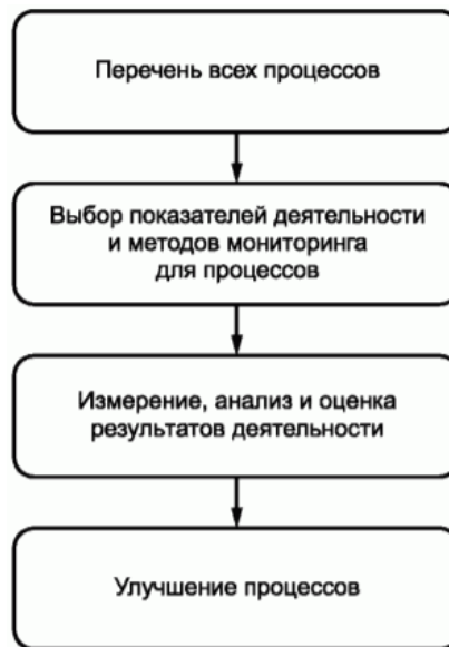
Рисунок 4 - Шаги для использования показателей деятельности

10.2.2 Методы, используемые для сбора информации в отношении показателей деятельности, следует выбирать таким образом, чтобы они были осуществимыми и подходящими для организации, например: