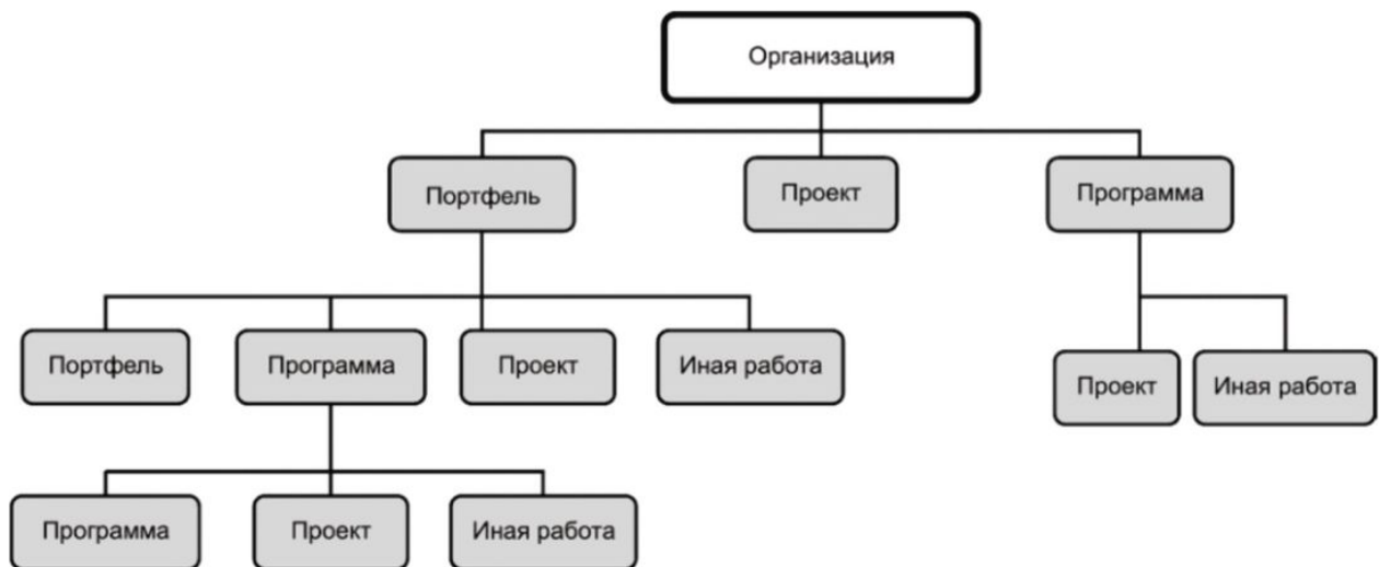
Рисунок 2 - Пример взаимосвязи между проектами, программами и портфелями

- портфели - это совокупности проектов, программ и иной соответствующей работы, которые осуществляются для содействия в достижении стратегических целей организации.